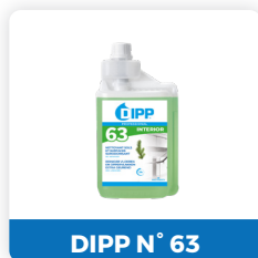
DIPP N° 63