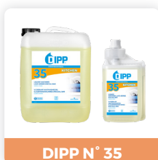
DIPP N° 35