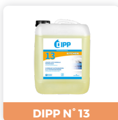
DIPP N° 13