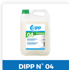
DIPP N° 04