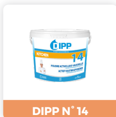
DIPP N° 14