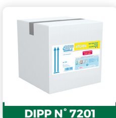
DIPP N° 7201