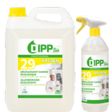
DIPP N° 29