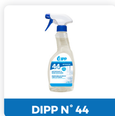
DIPP N° 44