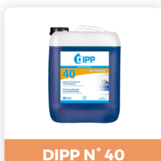
DIPP N° 40