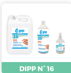
DIPP N° 16