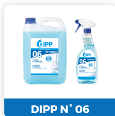
DIPP N° 06