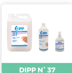
DIPP N° 37