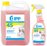
DIPP N° 45