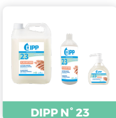
DIPP N° 23