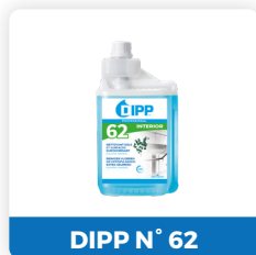
DIPP N° 62