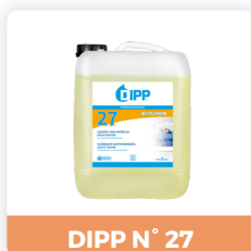
DIPP N° 27