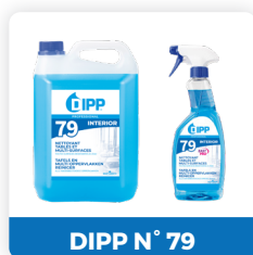
DIPP N° 79