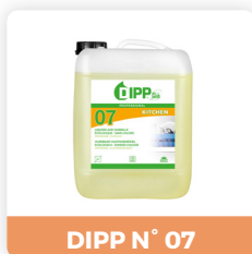
DIPP N° 07