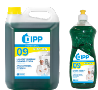
DIPP N° 09